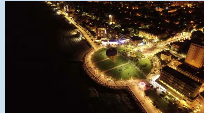
Pesaro - "Notte dei Desideri" presso la Sfera Grande di Arnaldo Pomodoro

Il mare è in grado di offrire molto agli appassionati di sport; numerose sono infatti le attività sportive che si possono praticare: wind surf, sci nautico, vela, immersioni subacquee, kitesurf, nuoto e beach volley.